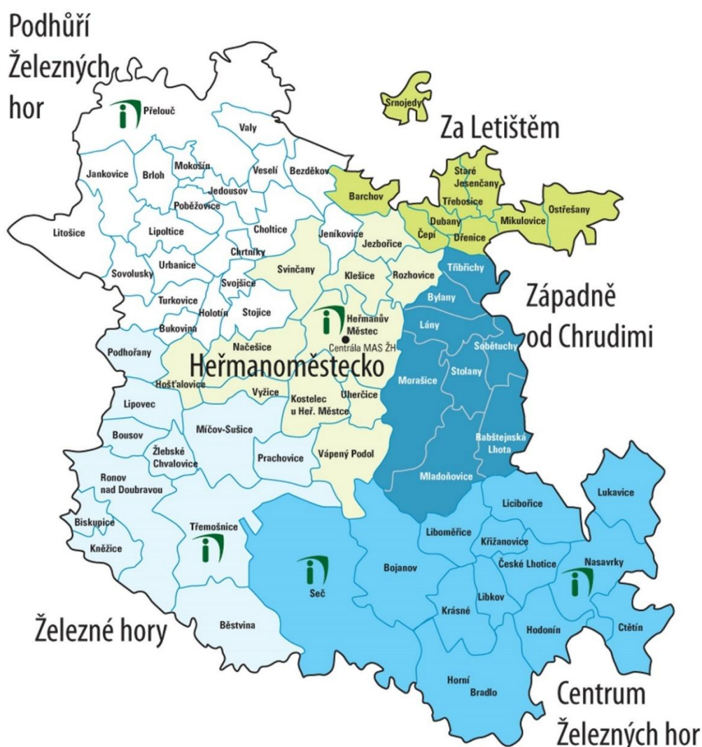
Obrázek 3 Území MAS Železnohorský region s dobrovolnými svazky obcí (DSO)

MAS Železnohorský region (MAS ŽR) byla založena v roce 2005 s právním statutem občanského sdružení. Od roku 2015 je MAS ŽR zapsaným spolkem. Sídlo MAS ŽR je v Multifunkční budově (kde sídlí také Informační centrum) v Heřmanově Městci. V současné době se území MAS ŽR rozkládá na území 6 svazků obcí (Heřmanoměstecko, Centrum Železných hor, Podhůří Železných hor, Za Letištěm, Západně od Chrudimi a Železné hory) a 1 obce Licibořice (viz níže mapa MAS Železnohorský region s dobrovolnými svazky obcí). Území má celkem 72 obcí a celkově kolem 45 tisíc obyvatel – z nichž na území ORP Přelouč se jedná o počet přibližně 12 tisíc obyvatel, což představuje cca 45 % všech obyvatel ORP Přelouč (celé ORP Přelouč má celkem 26 522 obyvatel k 31. 12. 2022).