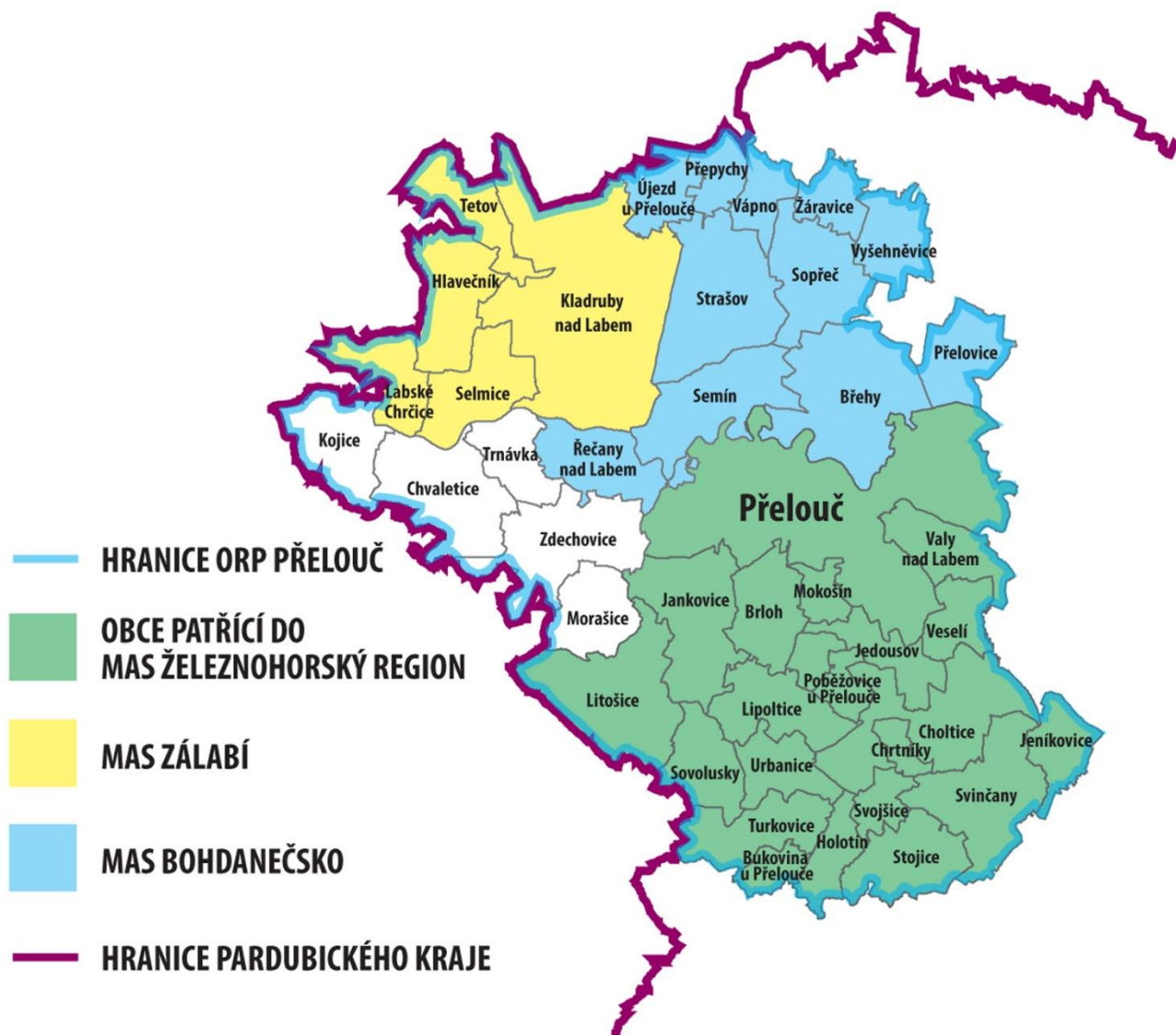
Obrázek 1 Struktura ORP Přebouč dle hranic MAS na území daného ORP

z nichž MAS Železnohorský region (MAS ŽR) zahrnuje nejvíce obcí z daného ORP a má v území nejdelší tradici (působí již od roku 2005). MAS ŽR je v tomto ORP také největší MAS, co se týče počtu obyvatel.